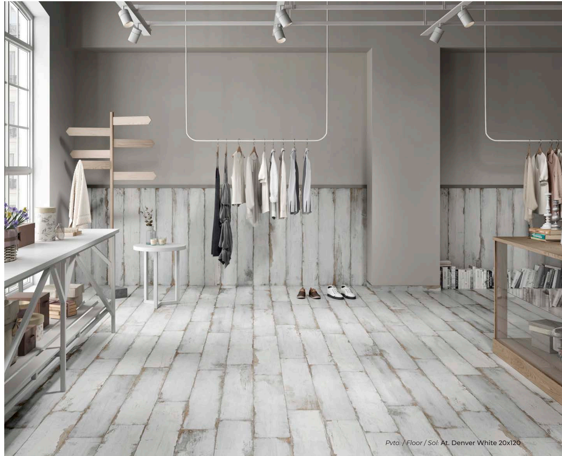
Pvto. / Floor / Sol: At. Denver White 20x120