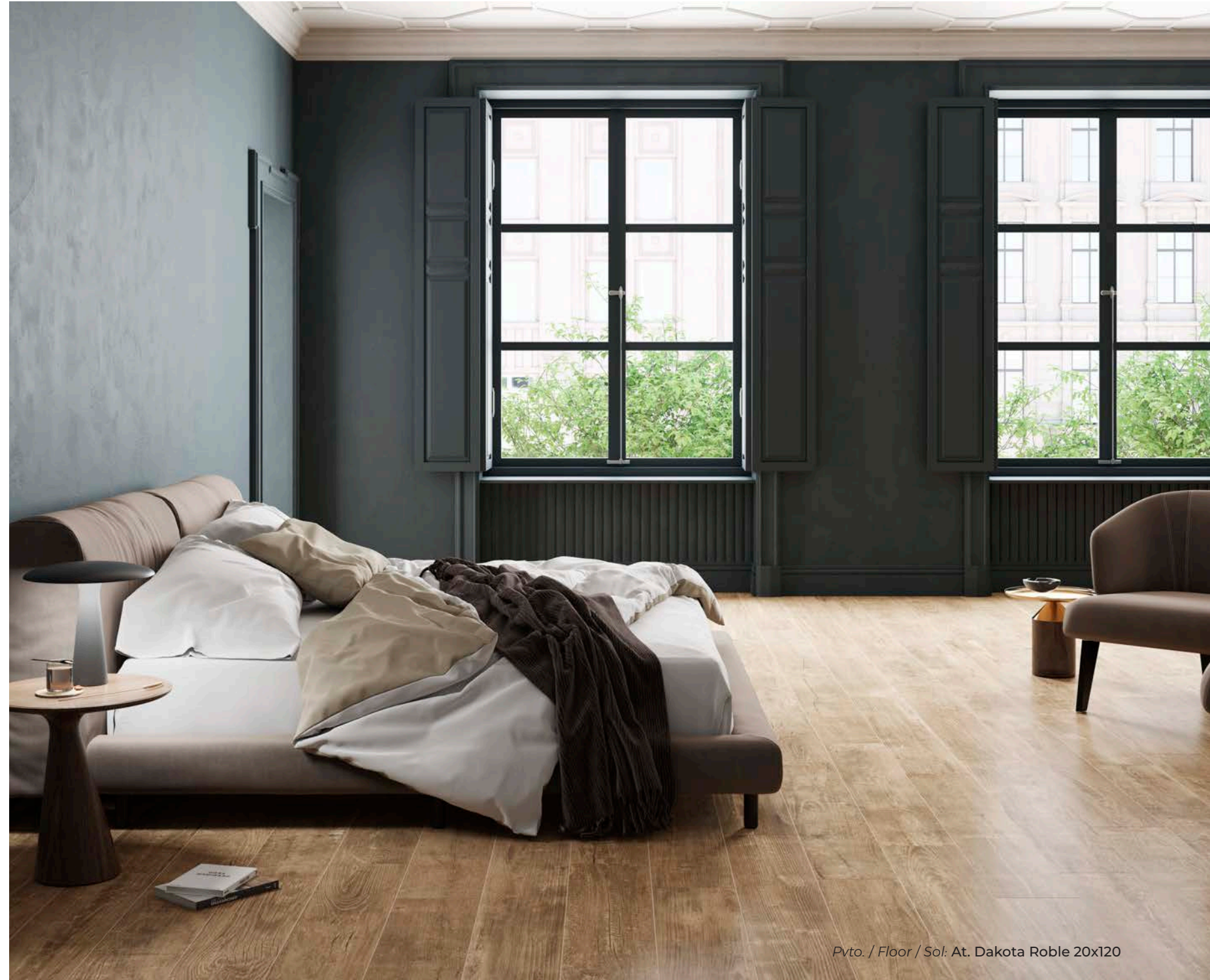
Pvto. / Floor / Sol: At. Dakota Roble 20x120