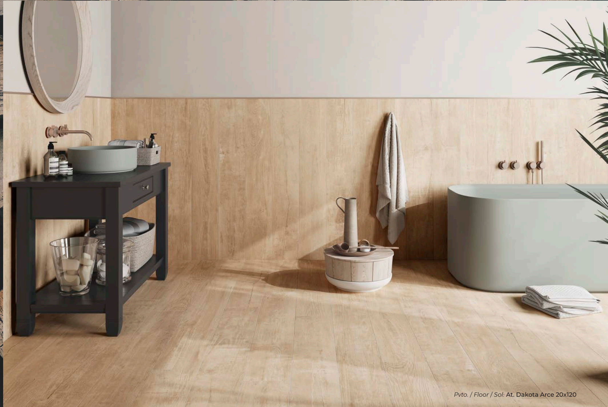
Pvto. / Floor / Sol: At. Dakota Arce 20x120