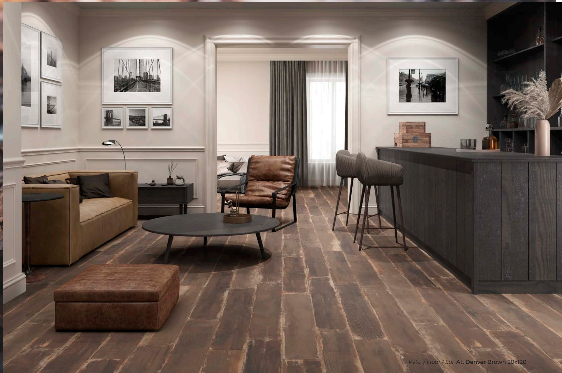
Pvto. / Floor / Sol: At. Denver Brown 20x120