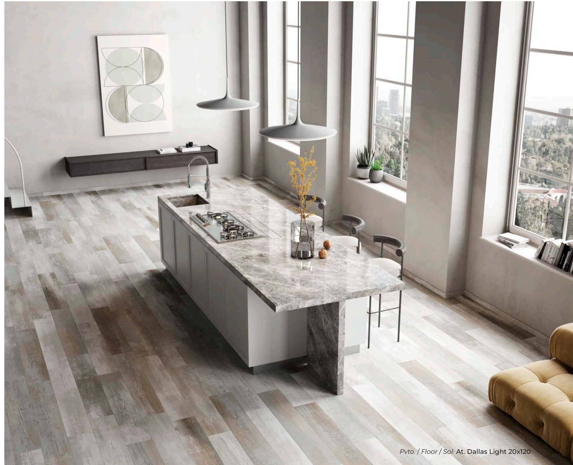
Pvto. / Floor / Sol: At. Dallas Light 20x120