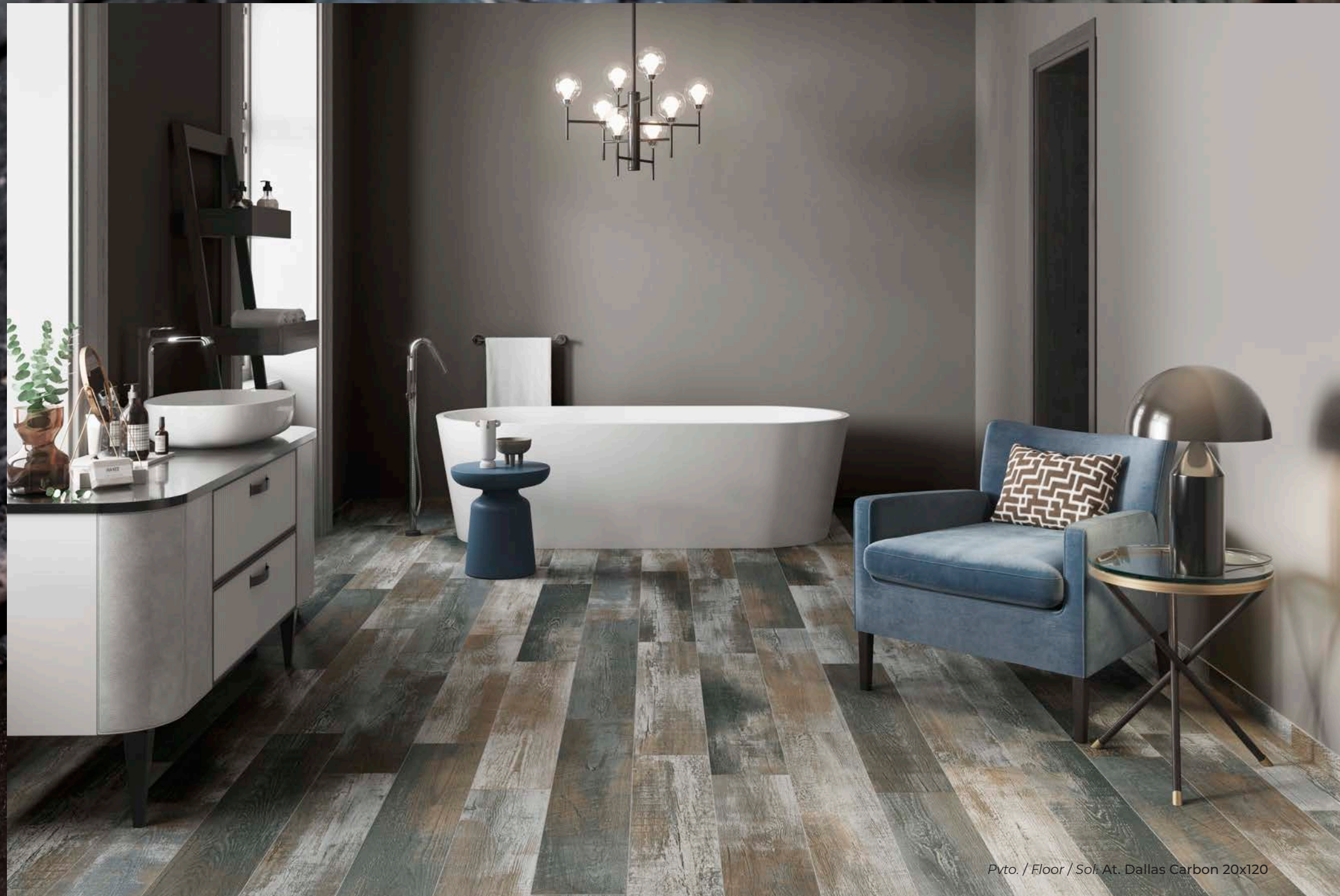
Pvto. / Floor / Sol. At. Dallas Carbon 20x120